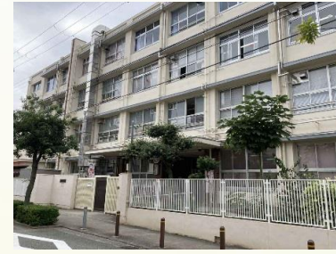
★弁天小学校 徒歩10分