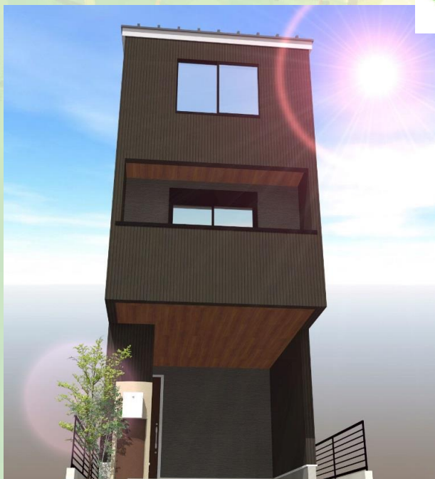
参考外観イメージ