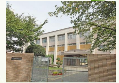
★市岡中学校 徒歩13分