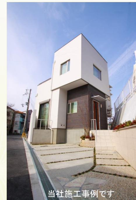
当社施工事例です