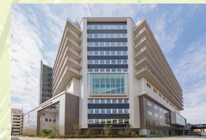
★大阪みなと中央病院 徒歩10分

再開発で今大注目の弁天町エリア♪ 駅直結の「大阪ベイタワー」には魅力的な施設が盛りだくさん♪