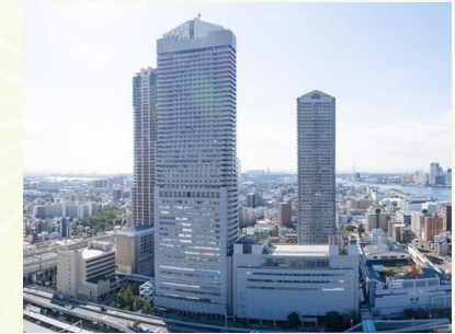
★大阪ベイタワー 徒歩5分