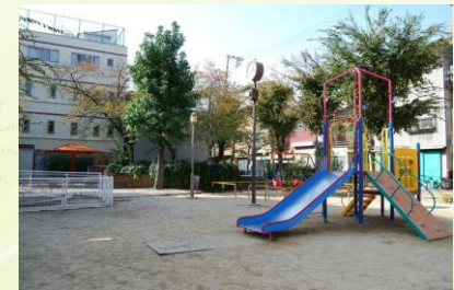
★弁天東公園 徒歩1分